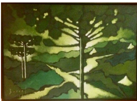
Título – Pinheiros e Casas.

Procure o Coordenador de Núcleo da AFA de sua região para adquirir um número, o sorteio será no dia 15 de dezembro.